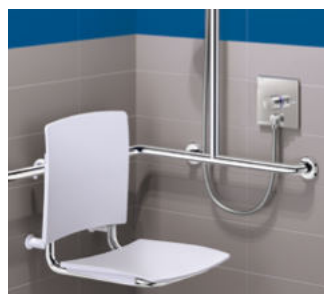
Montagebeispiele, Brause-Thermostatarmatur für Unterputzmontage Art. DELABIE: H96CBOX-H9633