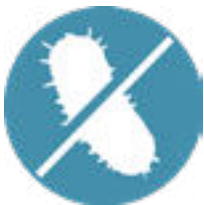
Hygiene und Begrenzung des Bakterienwachstums