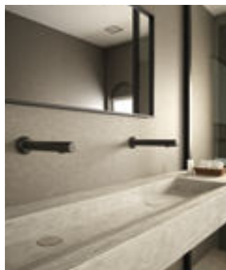
Montagebeispiel, BLACK BINOPTIC Wandmontage