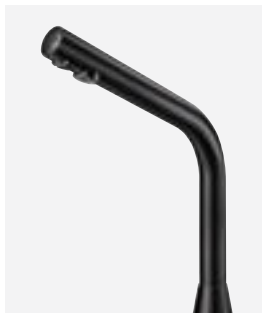
BLACK BINOPTIC H. 250 mm Art. DELABIE: 398035 (Netzbetrieb) und 498035 (Batteriebetrieb)