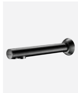
BLACK BINOPTIC Wandmontage Art. DELABIE: 379ENCB