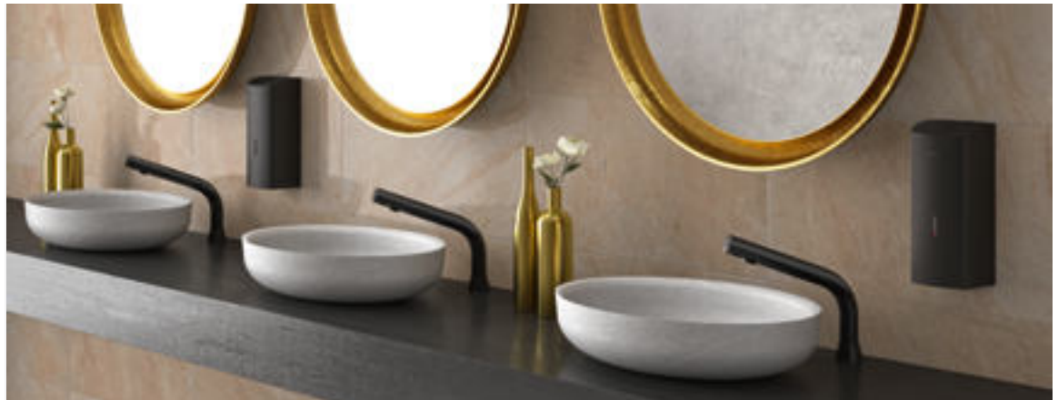
Art. DELABIE: 388035

DELABIE schlägt – an modernen Orten des Lebens wie Museen, Restaurants, Firmensitzen, Flughäfen – eine notwendige Brücke zwischen Design, Architektur und Funktionalität. Eine neue Erfahrung, die Leistung und Eleganz verbindet, wie mit dem neuen Materialfinish Chrom schwarz der Produktreihe elektronischer Armaturen BINOPTIC.