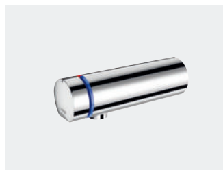
TEMPOMIX 3 (UP-Wasseranschlüsse) L. 110 Art. 794050

Das klare Design der TEMPOMIX 3 fügt sich harmonisch in jede Art öffentlicher Sanitärräume ein und wird gleichzeitig den verschiedenen Anforderungen hinsichtlich Vandalismus oder der Widerstandsfähigkeit gegenüber intensiver Nutzung, denen sie ausgesetzt sein können, gerecht.