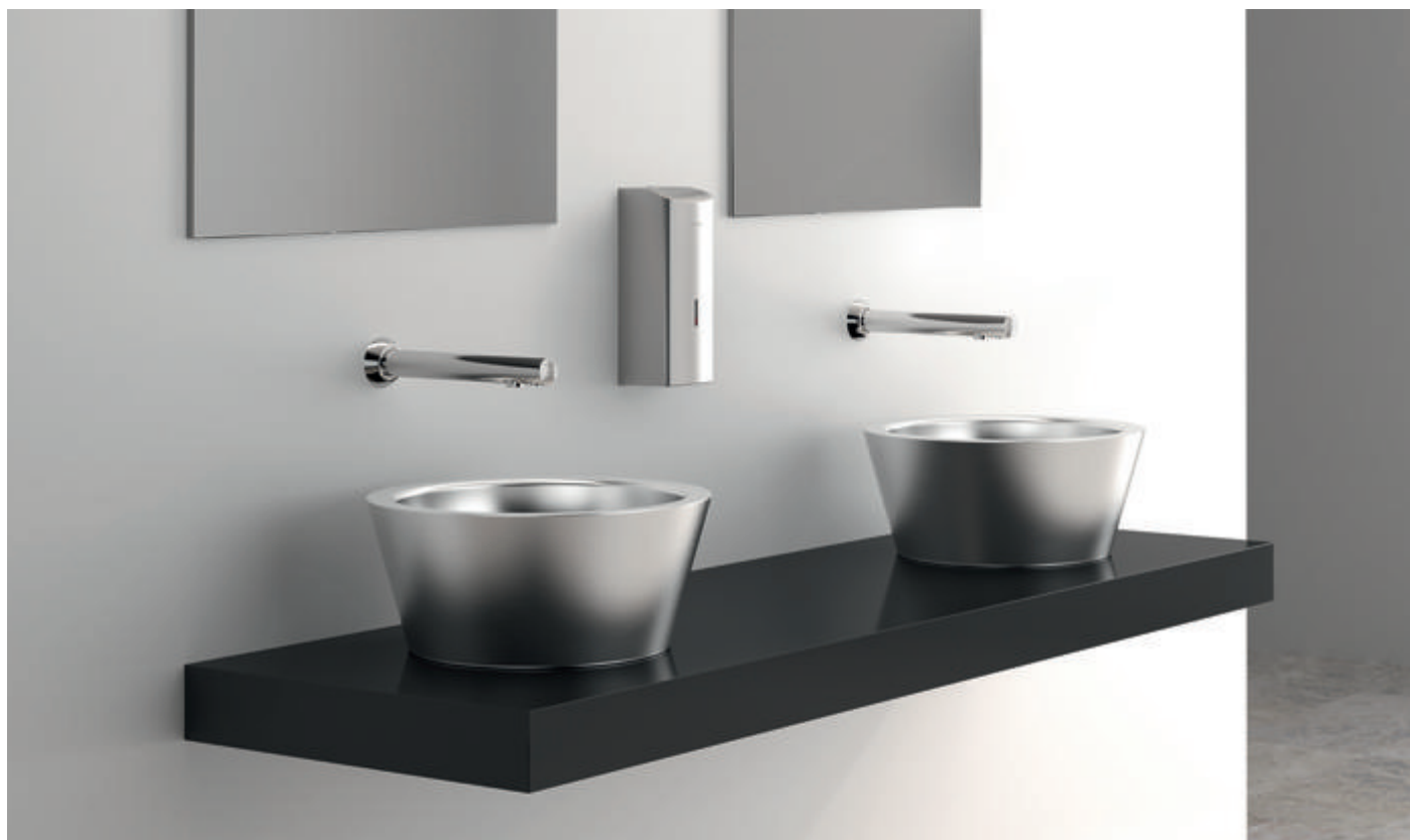
Aufsatzbecken ALGULI aus Edelstahl - Art. 120110, elektronisches Ventil BINOPTIC - Art. 379ENC, Edelstahlspiegel rechteckig - Art. 3459 und elektronischer Flüssigseifenspender für Wandmontage, Edelstahl Werkstoff 1.4301 - Art. 512066S

Im aktuellen Kontext der Pandemie stehen das Waschen und die Desinfektion der Hände im Mittelpunkt der Sorgen der Benutzer von Sanitärräumen im öffentlich-gewerblichen Bereich. Die Hygiene muss hier maximiert werden und berührungslose Lösungen sind sehr gefragt. Die strikte Einhaltung dieser präventiven Gesten gegen die Verbreitung von Viren geht jedoch mit einem hohen Wasser- und Energieverbrauch einher. Mehr denn je ist die Installation von Sanitär-Ausrüstungen mit zahlreichen Funktionalitäten, die für den Gebrauch im öffentlich Bereich geeignet sind, unerlässlich.