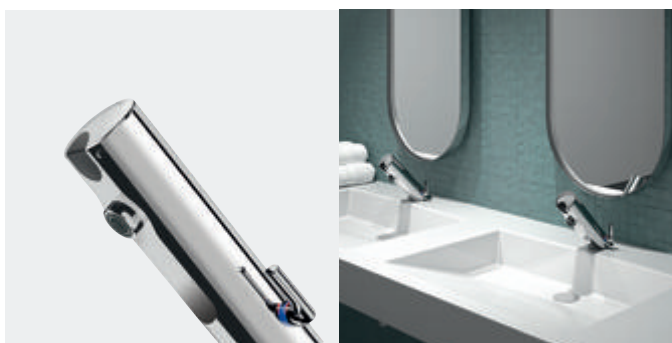
Elektronische Waschtisch-Mischbatterie TEMPOMATIC 4 Art. 490100

Alle Abbildungen sind auf der Website delabie.de verfügbar, Rubrik „Presse“.