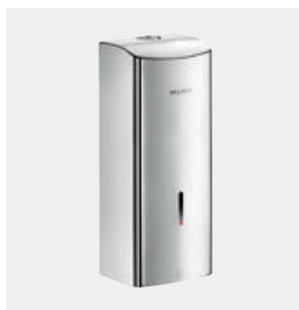
Elektronischer Spender für Flüssigseife oder hydroalkoholische Desinfektionslösung Art. 512066P