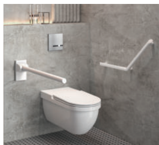
Montagebeispiel Stützklappgriff Art. 511964W

Erhältlich in zwei Oberflächen – pulverbeschichtet matt weiß oder anthrazit-metallic – gewährleistet Be-Line® eine visuell kontrastierende Gestaltung der Griffe zur Wand.