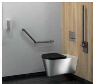
Montagebeispiel Stützklappgriff Art. 511964C