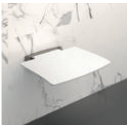
Duschklappsitz Be-Line® ohne Fuß