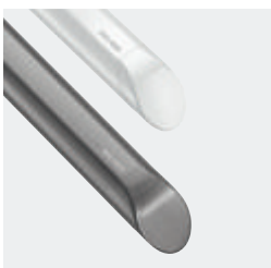
Haltegriffe Be-Line® anthrazit-metallic oder matt weiß