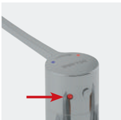
Möglichkeit der thermischen Desinfektion