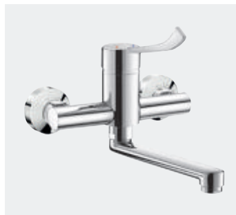
Einhebelmischer mit Druckausgleichsfunktion Securitouch für Wandmontage Schwenkauslauf Art. DELABIE: 2445LEP