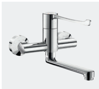
Sequentieller Einhebelmischer für Wandmontage Schwenkauslauf Art. DELABIE: 2436

Alle Abbildungen sind auf der Webseite delabie.de verfügbar, Rubrik „Presse“.