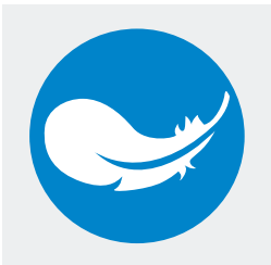
Verbesserte Ergonomie und Funktionalität