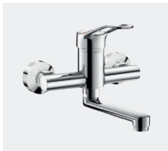
Sequentieller Einhebelmischer für Wandmontage Fester Auslauf Art. DELABIE: 2456