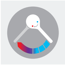
Sequentielles Öffnen und Schließen im Kaltwasserbereich

Der einzige sequentielle Einhebelmischer für Wandmontage auf dem Markt mit der Möglichkeit der thermischen Desinfektion ohne Demontage des Bediengriffs